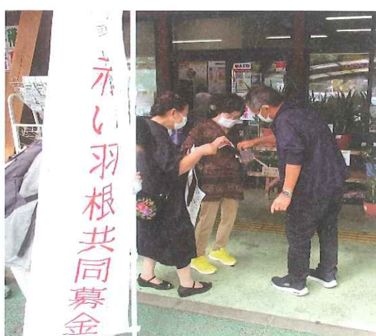
・氷川町ボランティア活動推進協議会の協力による街頭募金の様子(道の駅竜北)

また、10月3日(月)午前10時30分頃から氷川町道の駅竜北にて、社協職員並びに協力団体の皆さまによる街頭募金を実施しますので併せてご協力をお願いいたします。