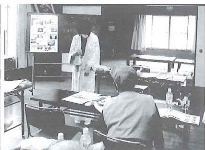
氷川町婦人会指導による炊き出し訓練