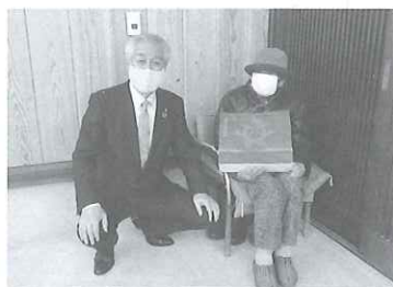
在宅高齢者友愛訪問