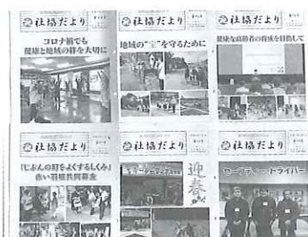
社協だよりの発行