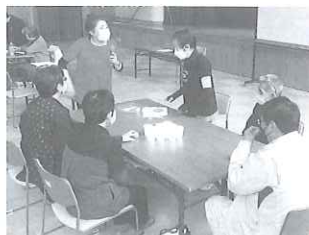
サロンプログラム ボランティア養成講座