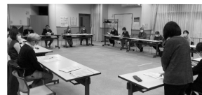
生活支援体制整備事業協議体