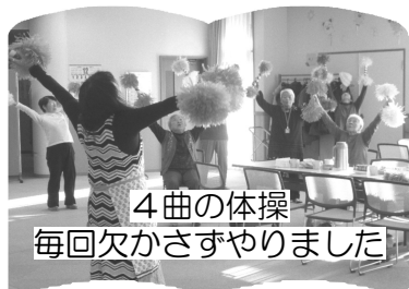
4曲の体操 毎回欠かさずやりました