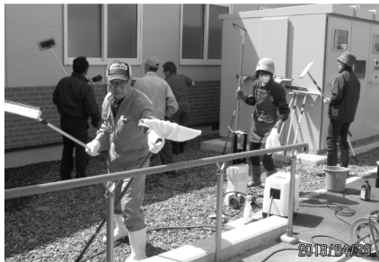
4/29 天理教の皆様（総勢25名） で窓はピッカピカ