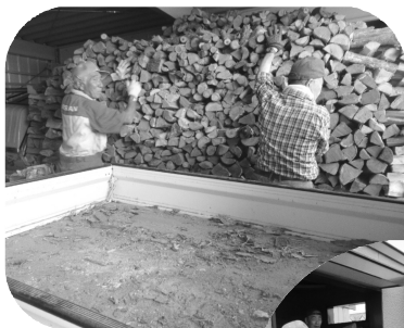
9/8 今年も新運び 冬の時期は これで心配なし