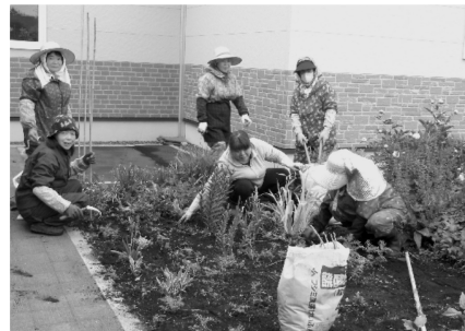
6/6、7/2、7/23 すずらん会の皆様のおかげで 花畑はきれいな花でいっぱい