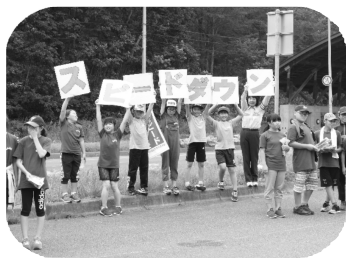
新得交通少年団 活動の様子