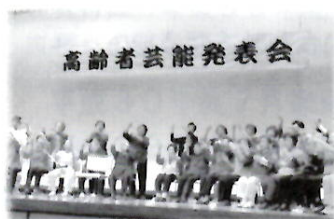
高齢者芸能発表会