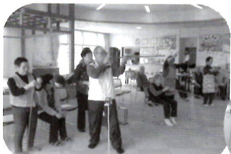
きらくなきすなの家（4／24）