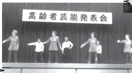
主役は全員！ 高齢者芸能発表会