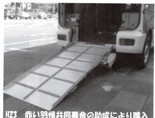
H23 赤い羽根共同募金の助成により購入

※利用希望や詳細については社会福祉協議会までお問い合わせください。（64-3253）