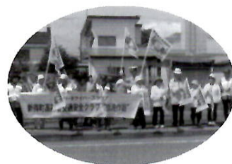
安全運転 旗波作戦