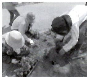
国道38号線 環境美化活動