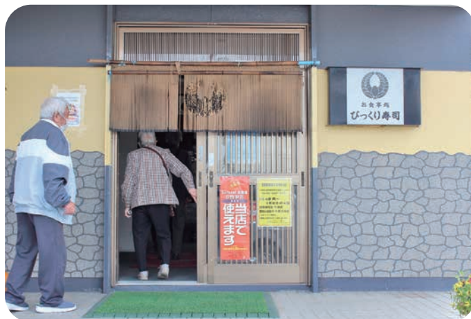
【外会場（びっくり寿し様）での会食へGO】

今年度のふれあい給食も昨年度同様、町内飲食店の皆様にご協力いただいています。おいしいお弁当ありがとうございます。