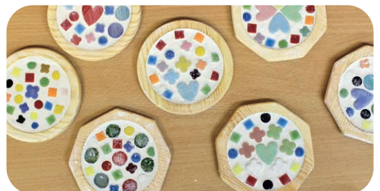
持ち帰って、さらに磨いてピカピカコースターの完成!!