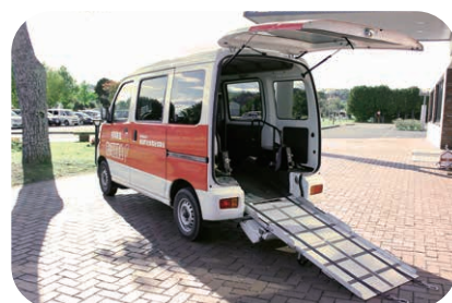
スロープ付き車いす移動車