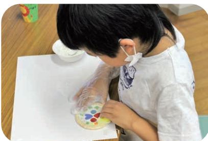
タイルの隙間にセメントを埋め込む作業