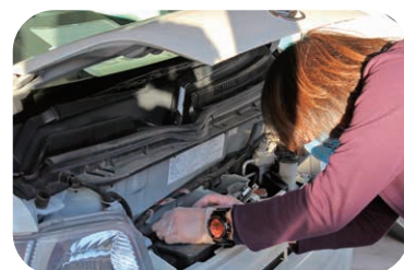
毎月の車両点検（10月の様子）