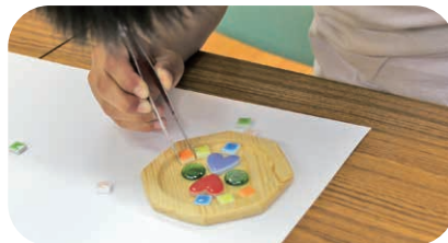
(写真上)コースターにタイルをならべて… (写真左)花型やハート、丸・四角 どのタイルにするか迷うな～