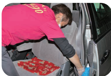
利用後の車内清掃