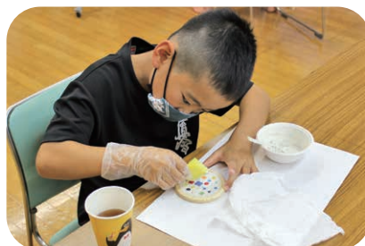
表面のセメントをふき取る作業