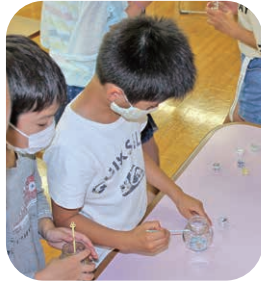
(写真上) (写真左) スパンコールや ラメアイテム ピンにたくさん 詰め込んで…