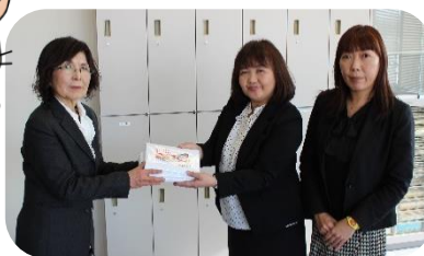
(写真1) 朝日生命釧路支部帯広班様