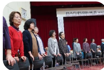
ボランティアミニ愛ランド 2019 in かみしほろ