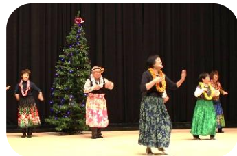
ふれあい給食（クリスマス会）