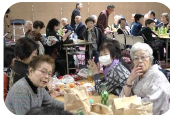
ひとり暮らし世帯一日芝居観賞