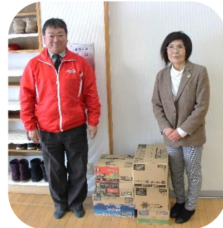
北海道コカ・コーラボトリング様 (写真→)

皆様から寄せられた善意の金品は、福祉基金として積立られ地域福祉の援護活動に有効に利用しております。