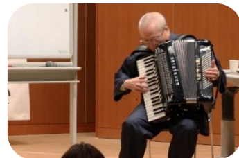
鹿追町社会福祉大会(2018年講演の様子)