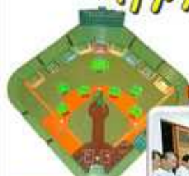
卓上の野球盤の基本はそのままに