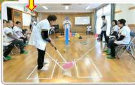
人が動いて楽しむように工夫したもの