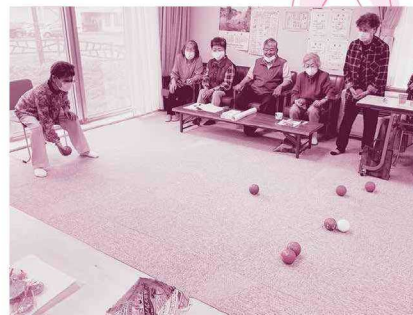
▲7/1 お茶の間中町サロン（タウンプラザ） 社協貸出用新レク用品「ポッチャ」を体験