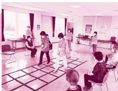
▲7/6 ふまねっと教室（タウンプラザ） 距離を取って予防対策をしながら実施