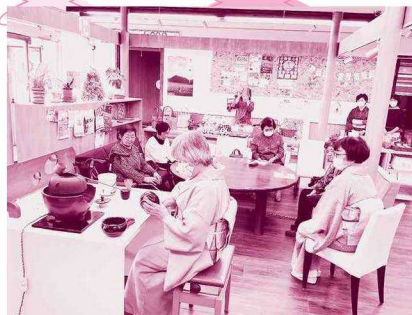
▲4/27 ふれあいサロンしほろ（みんなのまりのくまさん） 「しほろ抹茶の会」の皆さん（5名参加）によるお茶席を体験。