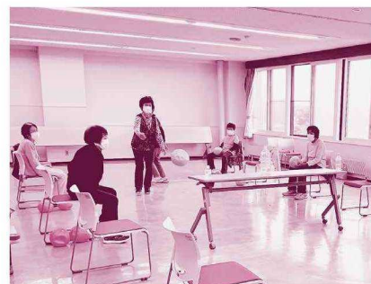
▲7/7 ガンバルーン愛好会（コミセン） チーム対戦形式のゲームで大盛り上がり