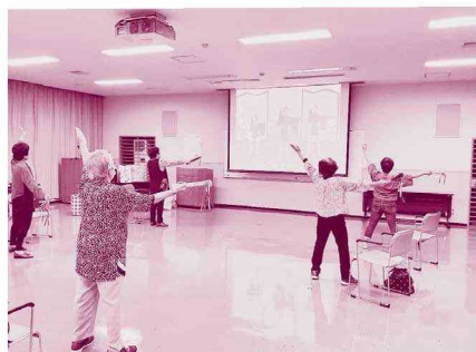
▲7/2 歌謡体操を楽しむ会（総合研修センター） 昭和歌謡に合わせて楽しく体操