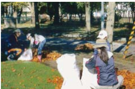
▲かしわ町育成会 地域清掃ボランティア活動

社会福祉協議会では、地域の中で「生きる力」と「豊かな心」をもった子どもたちを育むことを目的に、体験活動・福祉活動・地域交流等を行う団体に対して奨励金を（1団体20,000円）交付し、活動を応援しています。今年度本会が奨励した活動の一部をご紹介します。