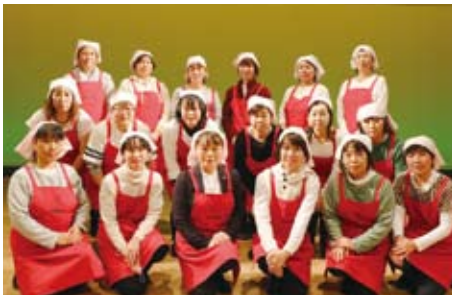
▲12/5 独居高齢者お楽しみ昼食会 (ボランティア協力：士幌町農協女性部の皆さん)