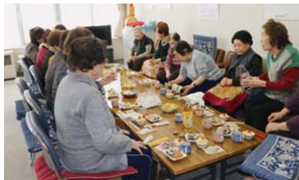
お茶の間中町（平成15年4月開設） 毎月第1・第3木曜日10:00～15:00 / タウンプラザ