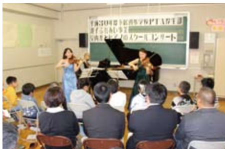
▲下居辺小学校PTA 親子ふれあい事業