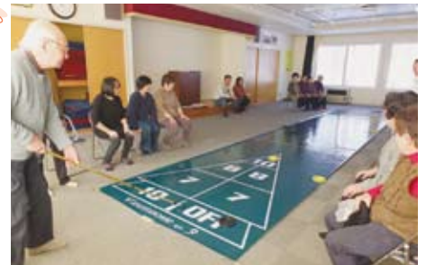
▲12/15 北地区ふれあいサロン 社協貸出レク用品(シャッフルボード)を活用