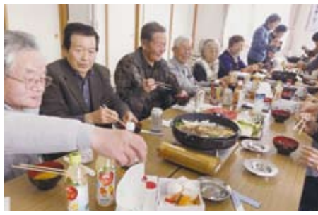
▲1/28 北中ふれあいサロン 老人クラブ合同新年会