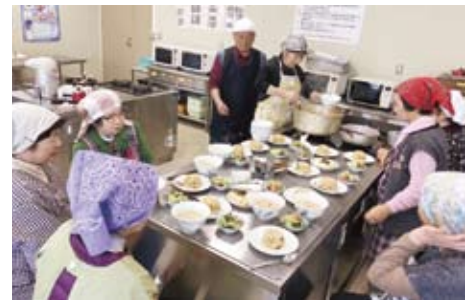
▲1/30 地場産物を食べる会 高齢者自身によるお料理とおしゃべり会