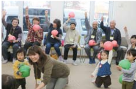
▲11/8 北町きらくサロン 認定こども園「キッズクラブ」と交流