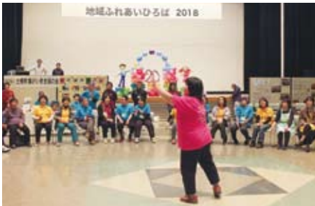
▲11/17 地域ふれあいひろば2018 (ミュージックケア体験)