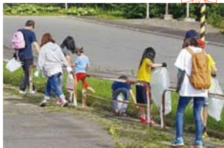
▲しらかば町育成会 地区公民館周辺ゴミ拾い活動