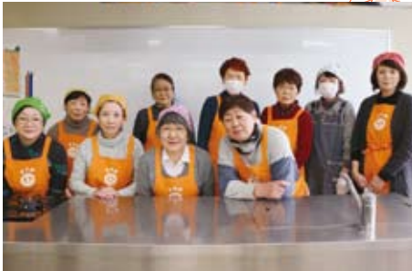
▲2/8 独居高齢者お楽しみ昼食会（ボランティア協力：士幌町商工会女性部の皆さん）