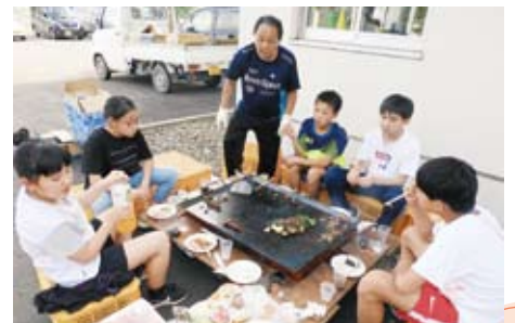
▲上居辺小学校PTA 児童・保護者・教師交流会