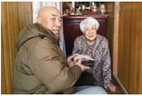
▲12/28 歳末おせち風弁当配達事業