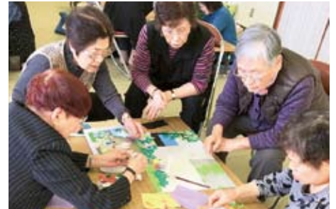
▲11/14 南町おたのしみサロン ちぎり絵づくり