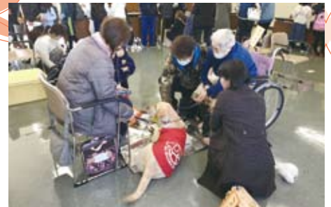
▲11/17 地域ふれあいひろば2018 (小動物ふれあい体験)