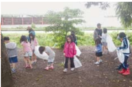
▲へいわ町育成会 生態観察・清掃活動