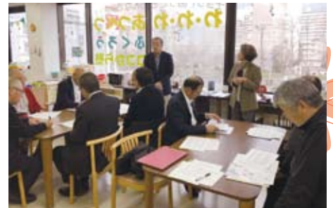
▲11/26 社会福祉協議会役員研修会 あつべつ・たすけ愛ふくろう(札幌市)視察