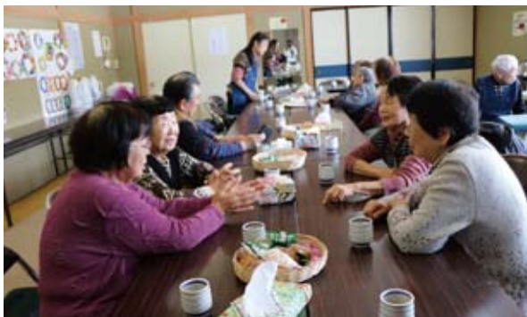
中土幌ふれあいサロン（平成15年5月開設） 毎月第2水曜日10:00～15:00 / 中土幌公民館