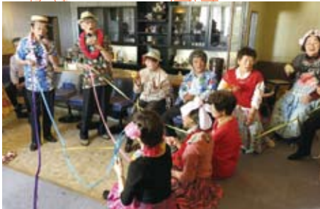
▲10/13 カラオケサロン悠歌 開設1周年記念(旧スナック旅路)