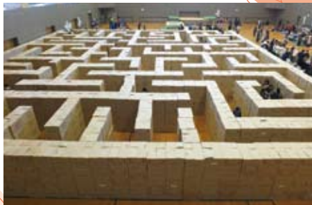
▲11/17 地域ふれあいひろば2018 (ダンボールめいろう)