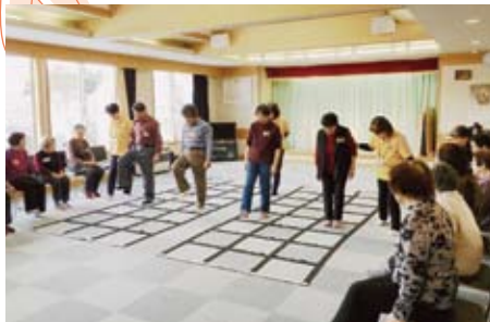
▲11/22 下居辺ゆう湯サロン ふまねっと出前教室