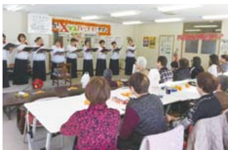
▲12/20 西町ふれあいサロン コーラスこもれびによる歌の披露(クリスマス会)