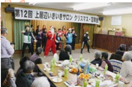
▲12/20 上居辺いきいきサロン 小学生による歌の披露(クリスマス忘年会)