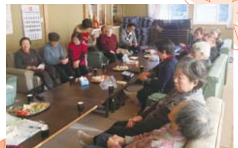
▲12/20 南地区いきいきサロン クリスマス会