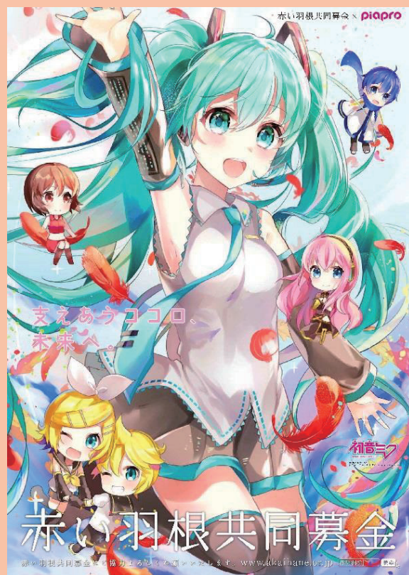
illustration by つかさ ©Crypton Future Media,INC. www.piapro.net piapro