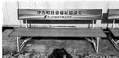
—— 町内での使い道 —— 公園等へのベンチ設置など