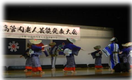
《2019. 6 芸能大会の様子》

各クラブごとの活動以外にも、9クラブの集合体「浦河町老人クラブ連合会」としての行事もあります。