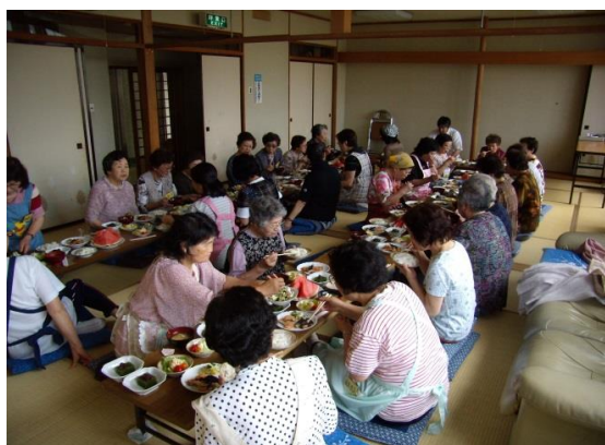
2010.7.5 第1回ふれあいサロン