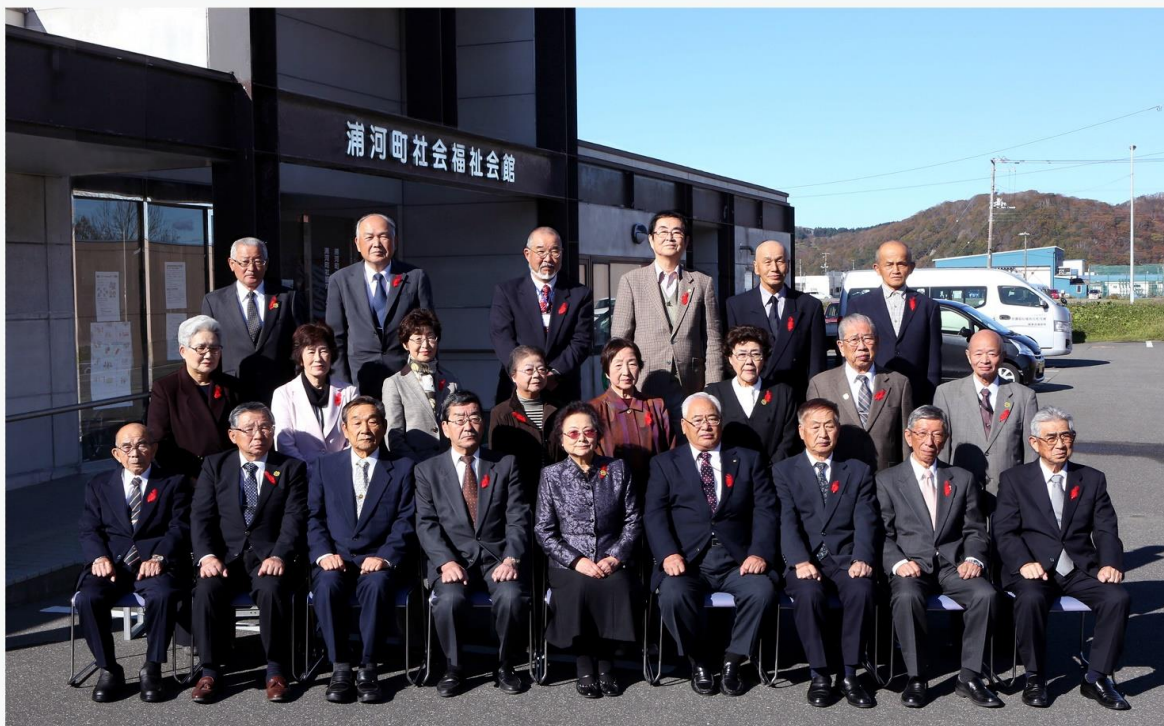
社会福祉法人 浦河町社会福祉協議会 法人設立 50 周年 役員・評議員 平成 30 年 11 月 1 日