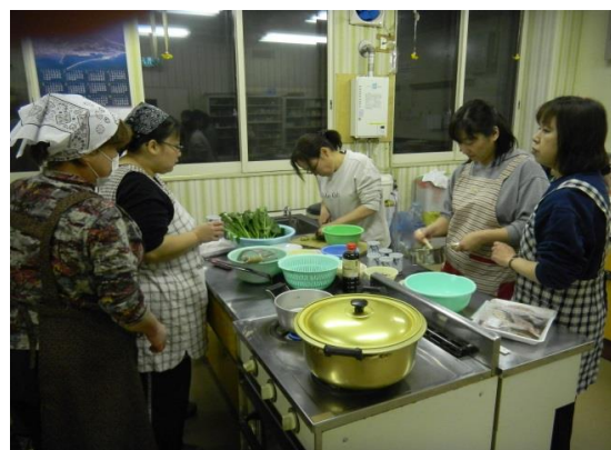
2012.3.6 ホームヘルパー職場内調理研修