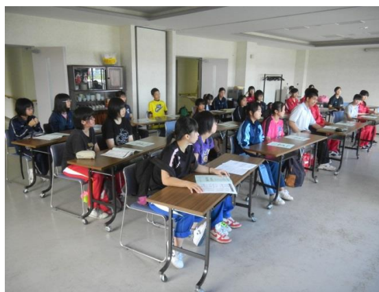
2013.8.1 中高生福祉体験活動