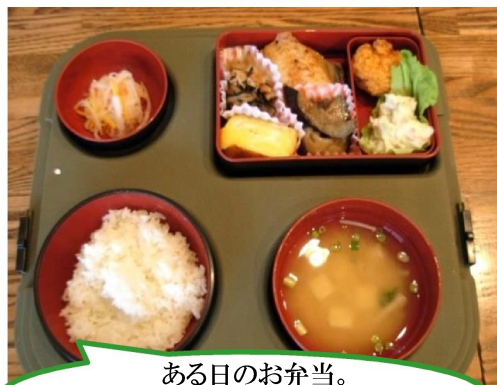
ある日のお弁当。 保温容器でお届けしています！