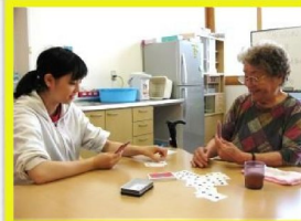
トランプもやりました