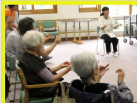
体操も一緒にやりましょう