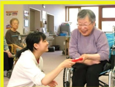
輪投げ頑張ってくださいね!