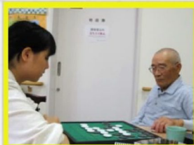
オセロの勝負です

7月11日～15日まで「北海道薬科大学」より実習生が来ました。 利用者のみなさんも実習生の明るい表情に自然と笑顔があふれていました。