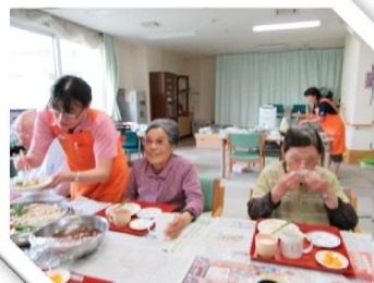
カボチャ団子が 大人気でした!

7月17日(日)に毎年恒例の焼肉パーティーを開催しました。 皆でホットプレートを囲みながら、美味しくたくさん食べられて いました!