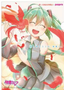
illustration by アイヲ © Crypton Future Media, INC. www.piapro.net piapro

サポーター宣言のファイターズ、タイアップのpiapro、妖怪ウォッチのグッズも活用しながら募金活動を実施していきます。