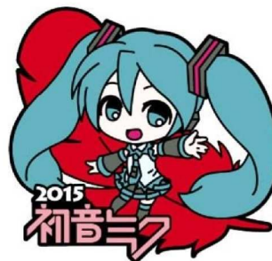
illustration by nekosumi © Crypton Future Media, INC. www.piapro.net piapro

クリアファイル、ピンバッチ、組み立て式募金箱など。赤い羽根のついたポスターが目印です。