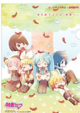
illustration by ゆくら © Crypton Future Media, INC. www.piapro.net piapro

illustration by アイヲ © Crypton Future Media, INC. www.piapro.net piapro