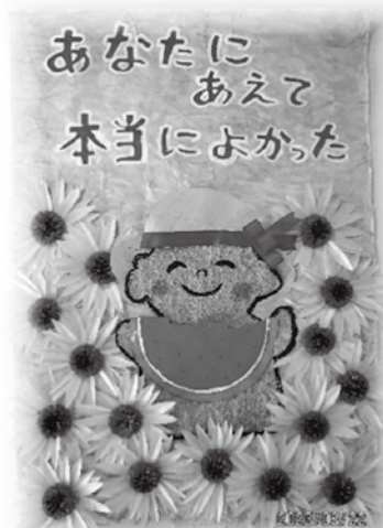
利用者の皆様と作った壁面作品

残りわずかとなりましたが、ご利用者様並びにご家族の皆様のお役に立てるよう、職員一同、最後まで精いっぱい努めてまいります。