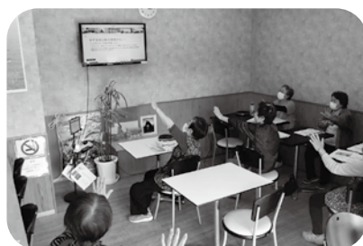
楽集ネットワーク活用事業