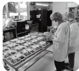
食事サービスボランティアなど