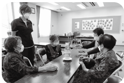
あったかハートサロン

社協事業のお手伝いや地域の活動に少しずつ参加してみましょう。社協職員と一緒に活動しますので、途中退室等にも対応できます。できそうな活動に短時間から参加して、徐々に関わりを増やしていきましょう。