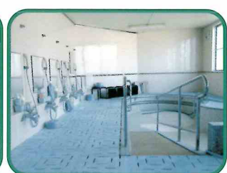
●車いすを利用している方も負担なく入浴できる浴槽