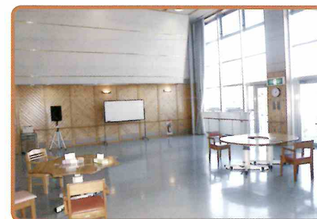
●娯楽室では、クラブ活動やレクリエーションなどを行います

入院加療をする必要のない65歳以上の方で、環境上の理由や経済的理由により在宅において生活することが困難な方が対象となります。