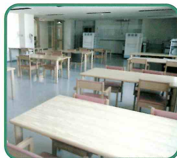
●介護用テーブルを備えた食堂