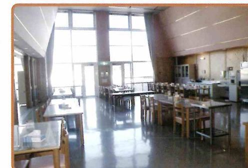
●天井が高く開放感のある食堂

居室は全室個室で、入園者様のプライバシーを保持します。パークゴルフ、絵画、書道、カラオケ等のクラブ活動や各種行事も充実しており、心豊かな生活を送ることができます。