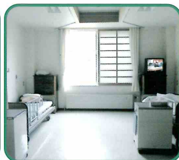
●居室は4人部屋と2人部屋がございます