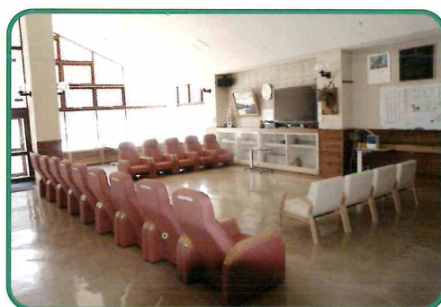
●明るい陽射しいっぱいの玄関ホール

65歳以上で、在宅での介護が難しく、医療行為を受ける必要のない方、また、「要介護」の認定を受けている方が対象となります。