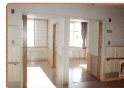
●居室は1階が洋室、2階は和室となっております ご夫婦で入居できるお部屋もございます

家庭的で快適な生活が送れるよう、入園者様の心身の健康を気遣いながら豊かな愛情あるサービスで支援いたします。また、「要支援」「要介護」の認定を受けている方は、各種介護サービスをご利用いただけます。