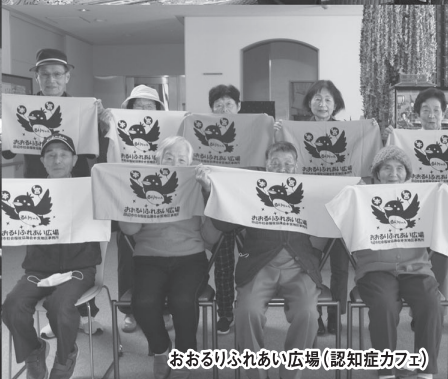
おおりふれあい広場(認知症カフェ)