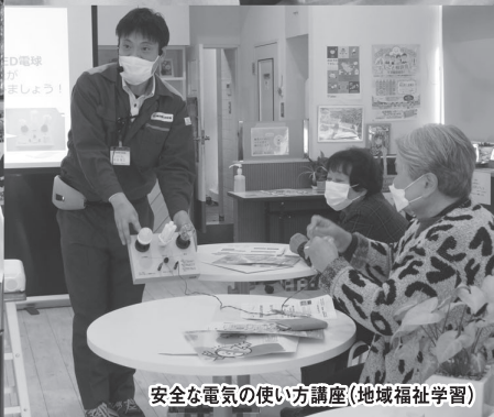
安全な電気の使い方講座(地域福祉学習)