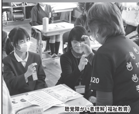
聴覚障がい者理解(福祉教育)