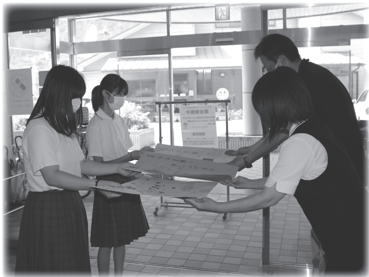
制作物を届ける生徒の様子

生活委員会でジャンボ暑中見舞いと、ジャンボ年賀状を制作し、地域の高齢者施設「介護老人保健施設あきつ」へ届けました。みんなでアイディアを出し合い、入居者や施設のスタッフのみなさんに「喜んでもらえるかな」と気持ちを込めて制作しました。