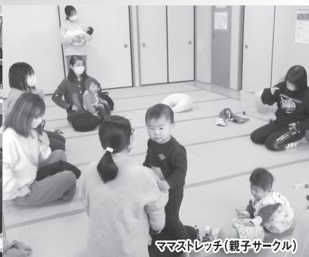
ママストレッチ(親子サークル)