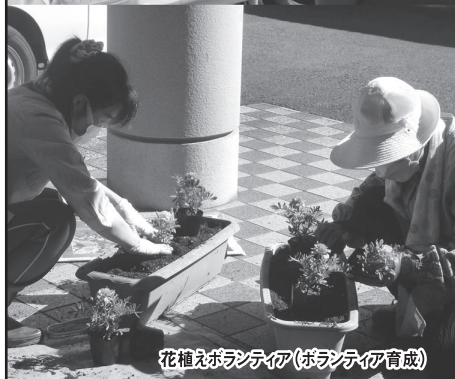
花植えボランティア(ボランティア育成)