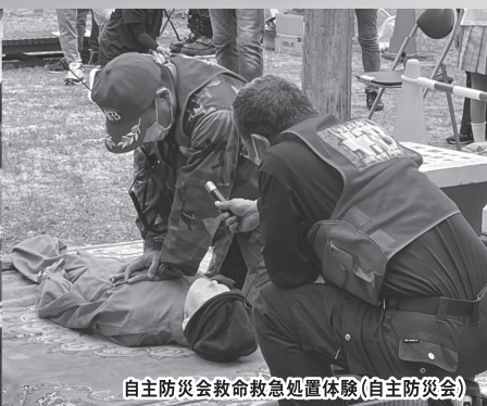
自主防災会救命救急処置体験(自主防災会)