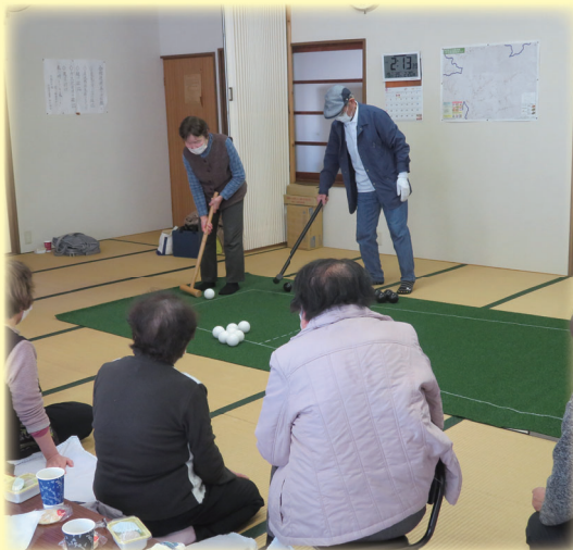
サロン活動の様子