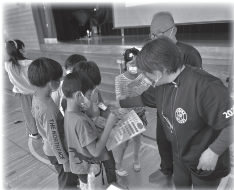
聴覚障がい者理解学習の様子

「児童の感想より」 私の家の近くには、障がいの ある方が暮らしています。声 では会話をすることができな いので、手話を使っています。 そんな様子を見た私は、「み んなが手話で会話することが できれば、みんながもっと幸 せになれるの。」と思いまし た。なので、私は障がいがな い人もある人も暮らしやすい 環境にしていく必要があるこ とが分かりました。