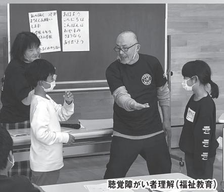
聴覚障がい者理解(福祉教育)