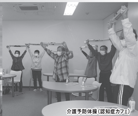
介護予防体操(認知症カフェ)