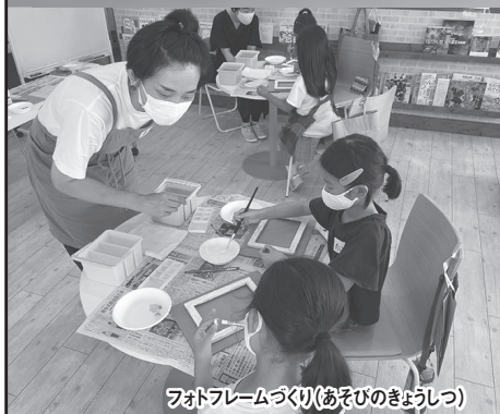
フォトフレームづくり(あそびのきょうしつ)