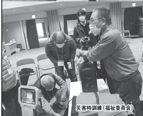
災害時訓練(福祉委員会)