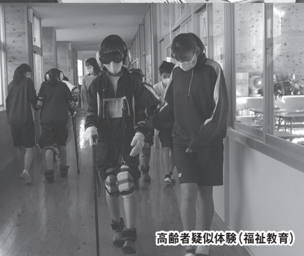
高齢者疑似体験(福祉教育)