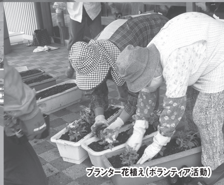
プランター花植え(ボランティア活動)