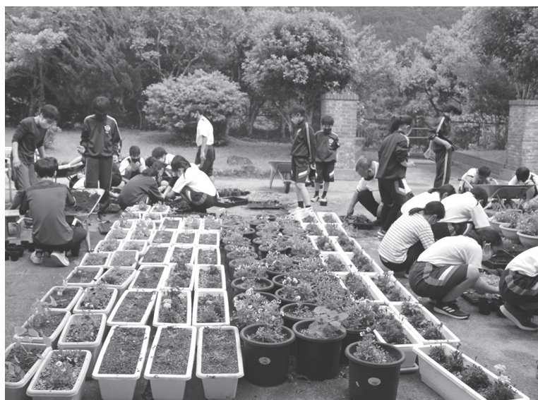
花植え活動の様子

中辺路中学校では、毎年「花いっぱい運動」に取り組んでいます。今年度は、SDGsの観点から、お花をもらってくださる地域の方々にお願いして、ペットボトルを回収する取り組みも行いました。地域と交流しながら、環境問題についても考えるよい機会となりました。