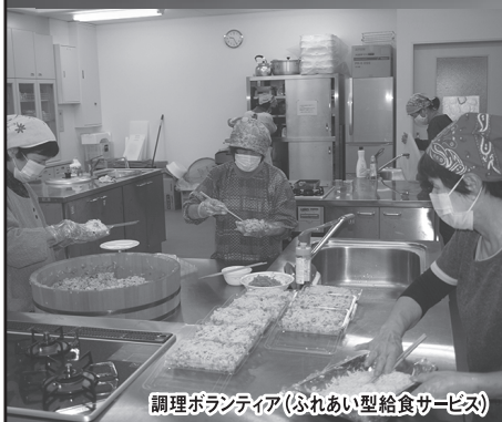
調理ボランティア(ふれあい型給食サービス)