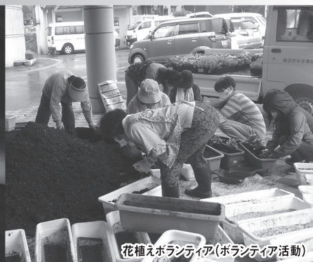
花植えボランティア(ボランティア活動)