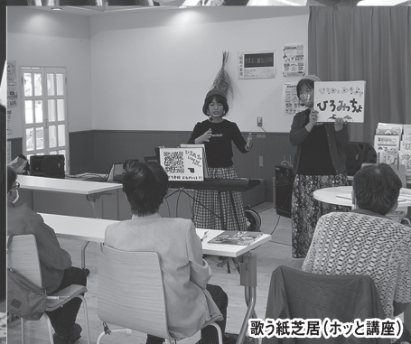
歌う紙芝居(ホッと講座)