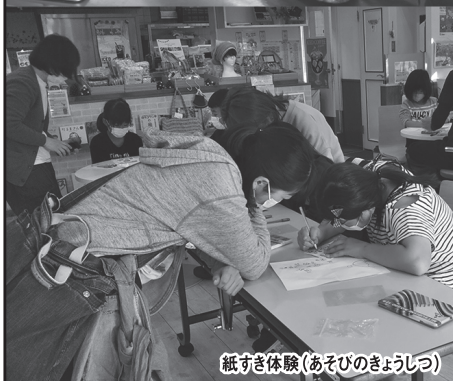
紙すき体験(あそびのきょうしつ)