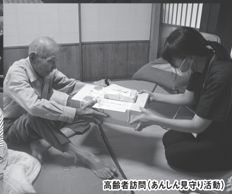
高齢者訪問(あんしん見守り活動)