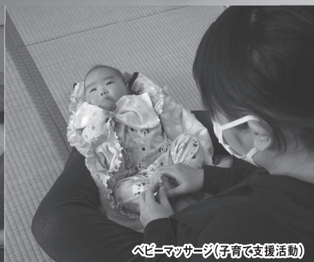
ベビーマッサージ(子育て支援活動)