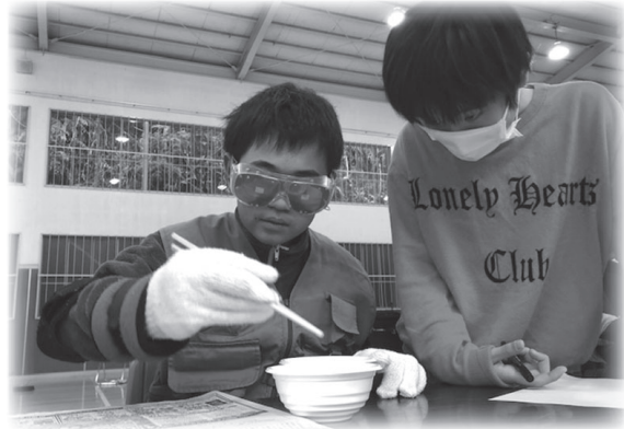
高齢者疑似体験の様子

私は福祉体験学習をして、高齢者や障がい者の人達はとてもたいへんだと思いました。車いす体験では、最初「そこまで怖くないでしょ。」ぐらいにしか思っていなかったけど、実際体験してみるととてもこわかったです。もし、高齢者や障がい者の人が困っていたら自分から声をかけて行動していきたいです。