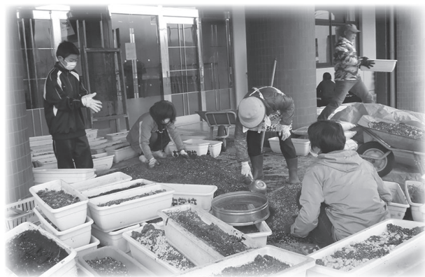
花植え活動の様子

本校では、共育コミュニティの花植え活動を冬場に行います。市女性会本宮支部、本宮中ふれあい隊、行政局の方々、地域の方々の協力を得て、生徒も一緒に花植えをしています。生徒は、町内にプランター配布することで、地域を見直す機会となりました。