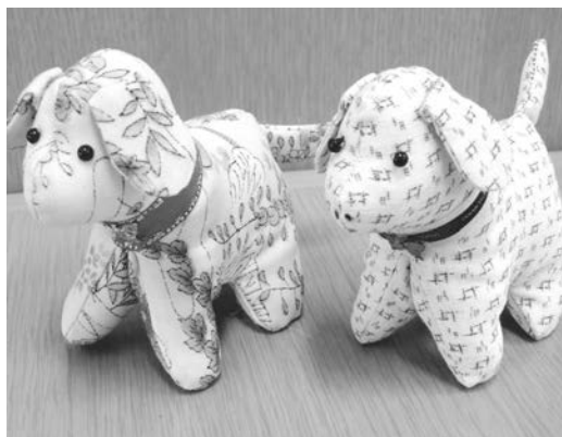
平成30年干支のマスコット