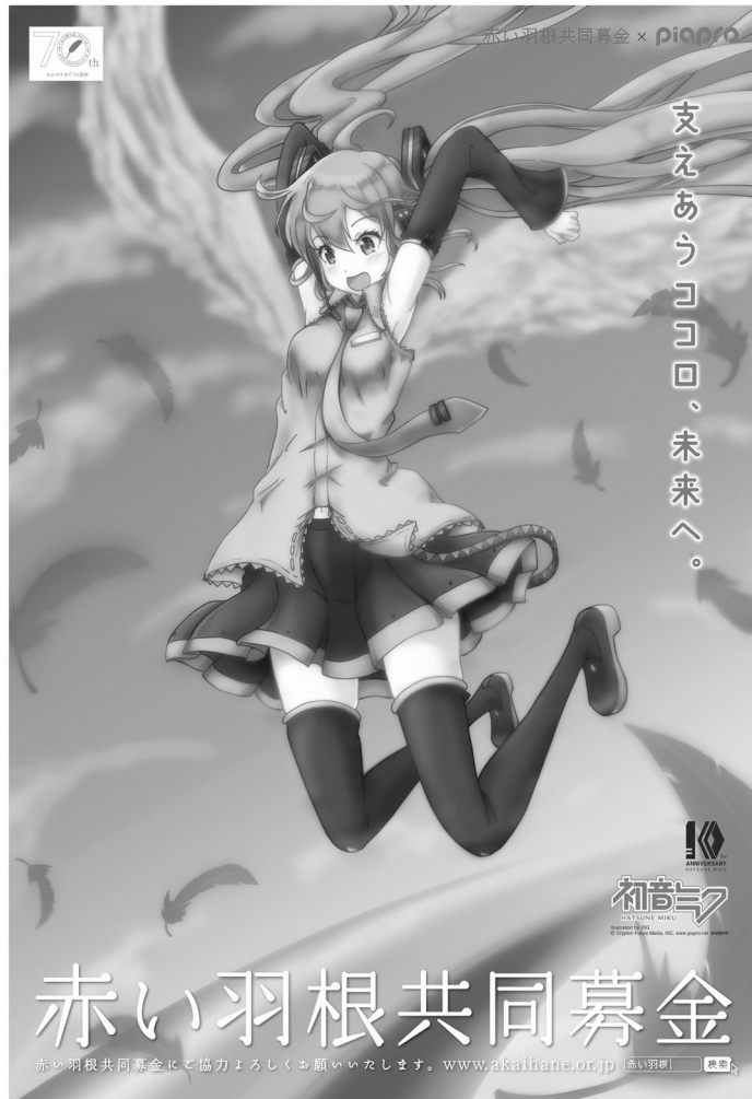
illustration by 冨田 晴 © Crypton Future Media, INC. www.piapro.net piapro