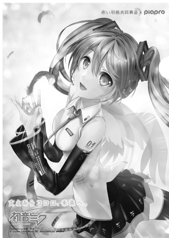
illustration by 白羊 ゆき © Crypton Future Media, INC. www.piapro.net piapro

昭和22年から始まった共同募金運動は、今年で70回目を迎えます。長年、運動に携わっていただいたボランティアの皆様や、寄付者の皆様に心よりお礼申し上げます。