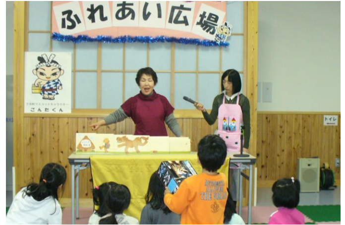
下市おはなしの会さんの「おはなし会」