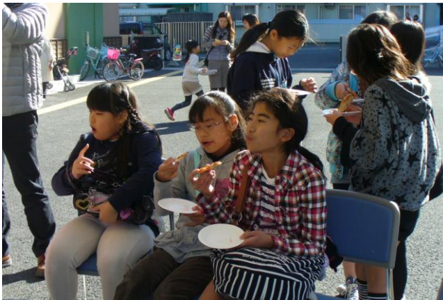
温かくて美味しいー 豚汁とピザをいただきました。（*^_^*）

老人クラブ女性部の皆さんと一緒に遊ぶ昔遊びコーナーや学生ボランティアによるプレート作り、くるみさんのおしゃれなクリスマスリース作り。ホールでは、下市おはなしの会によるお話や、丹生駐在所のおまわりさんによるサックス演奏が披露されました、子育て支援スタッフによる手作りのジャンボかるた大会では、子ども達の白熱な戦いが繰り広げられました。