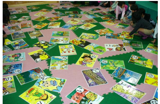
スタッフ手作りの「ごんたくんカルタ」 町内のイベント、集会に貸出しします。詳しくは、☎6125迄