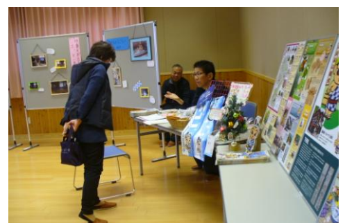
ごんたくんグッズ販売と ごんたくんの日を写真で紹介。