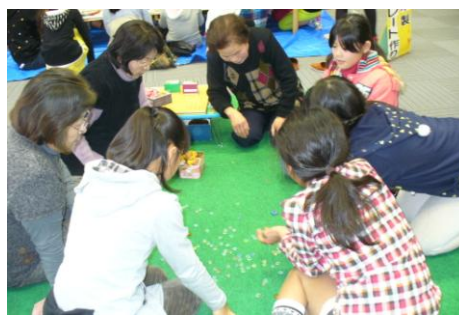
おかし遊びコーナー 「おはじき」