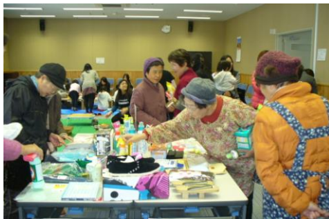
恒例のバザーは大盛況！

最後に、サックス演奏に合わせ手話を使った「ふるさと」の合唱で幕を閉じました。賑やかで楽しい世代を超えた交流ができました。 また、バザーが行われ、下市町共同募金委員会のコーナーでの売上金1万7千300円は『歳末たすけあい募金』として寄付させて頂きました。ご協力頂いた皆様に感謝申し上げます。 下市町社会福祉協議会では、交流センターを町民の皆さんの幅広い交流の場となるよう、今後もこのようなイベントを開催していきたいと思っています。