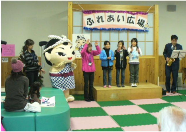
手話で歌う「ふるさと」子ども達も上手にできました。