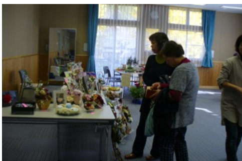
「くるみ」さんと「こごち」さんの展示販売コーナー