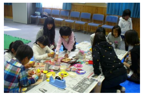
子ども達に人気のプレート作り