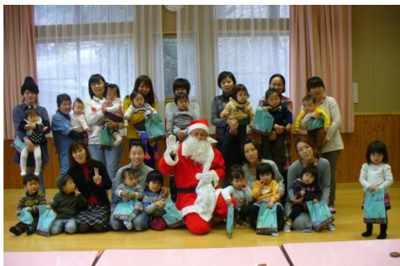
サンタさんと記念撮影！

12月16日『子育てサークルでんむし』と12月17日『ふれあい子育てサロンに』それぞれサンタさんが来てくれました。 突然訪れたサンタさんに少し戸惑いを見せる子ども達。 「メリークリスマス」良い子のみんなにサンタさんからの贈り物が届けられました。 サンタさんに元気に「ありがとう」のあいさつが出来ました。