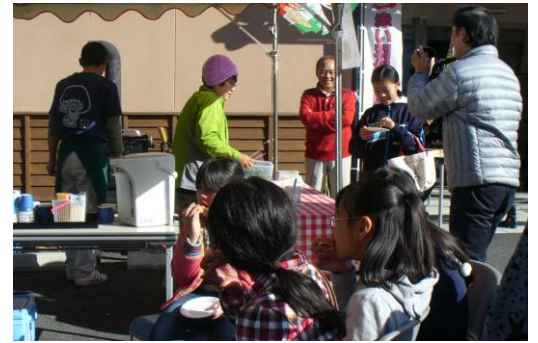
玄関前で豚汁とピザがふるまわれました。

11月30日、町交流センター（ごんたくんの家）において、第4回ふれあい広場が開催されました。