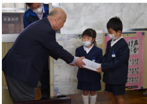
下市町民生児童委員協議会から防犯ブザー