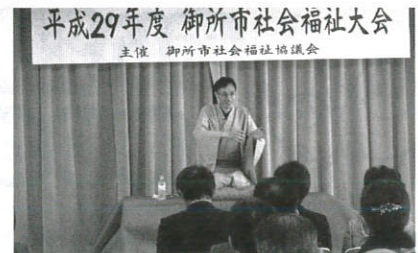
平成29年度 御所市社会福祉大会