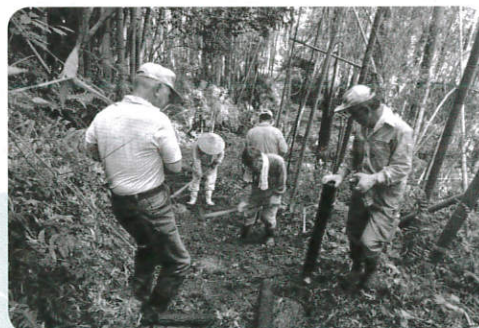
葛城古道の整備の様子

これからも人生を楽しく、豊かにすると共に、郷土の発展を考えて活動していきたいと思えます。