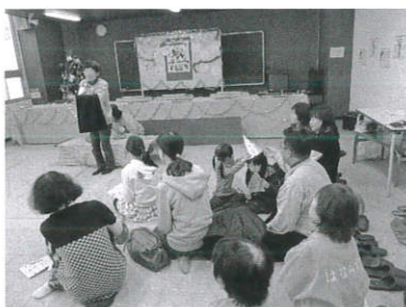
クリスマス会の様子

平成28年12月18日(日)には「クリスマス 会」を開催しました。16名の親子が参加され、「お はなし会」のクリスマス話や「大正琴フラワー」に よる大正琴演奏を楽しんでいました。サンタさんか らプレゼントを貰い、ケーキを食べてみんな楽しく 過ごされていました。