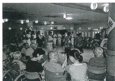
さうす国見夏祭りの様子

市内の高齢者・ 障害者施設が行っ ている、入所者と 地域の方との交流 を図るための事業 に助成しています。