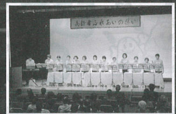
ハンドベル演奏の様子