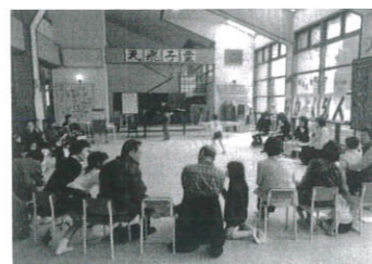
名柄小学校世代間交流の様子

※主な活動・・・通学路や校区の清掃、昔遊 びなど世代間交流、 施設入所者との交流 など