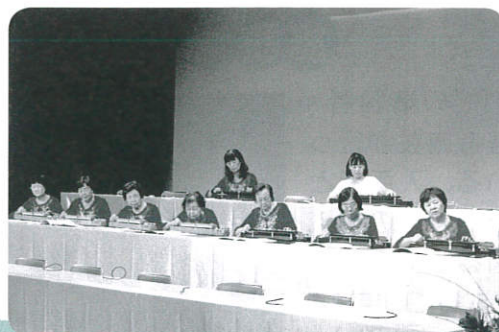
発表会での演奏の様子