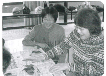
お手つき!! 葉っぱでカルタ

20名の方が参加され、ゲームを通じてコミュニケーションをとる方法を学習しました。講座とは思えないほど楽しく盛り上がりました。