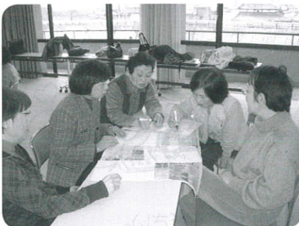
自分曆を作る作業。どんな季節を感じてますか？

平成23年1月24日(月)、《コミュニケーション手段としてのネイチャーゲーム》と題し、養成講座を実施しました。