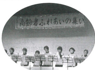
ハンドベル演奏の様子