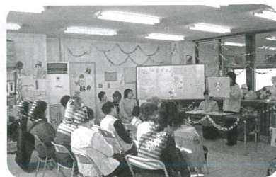
クリスマスのおはなしの様子

曜日：毎週火・木曜日 ※祝日は除く 時間：13:30～17:00 お茶を飲みながらお話したり、折り紙や体操などをしながらみなさんと遊びませんか？どなたでも、お気軽にお越しください。