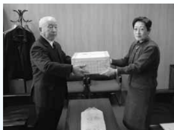
中頭取(左)、増田理事長(右)

五條市善意銀行にいただいた皆さまからのご寄付の一部を払い出し、こども達のために役立てていただこうと、3月12日に児童養護施設「社会福祉法人嚶鳴学院」へ文具一式を寄贈しました。