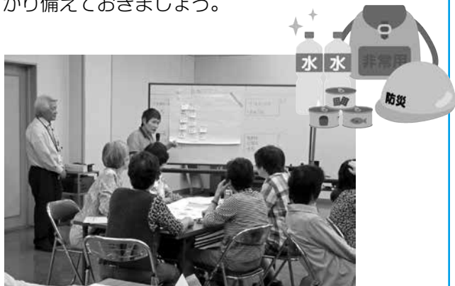
グループ発表の様子