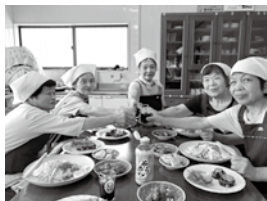
『宇智地区サロン ひまわり』

地区社協が実施する高齢者・子育てサロン、世代間交流や敬老会などの福祉活動のために。