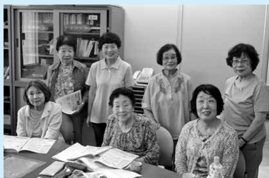
録音ボランティアグループ「青い鳥」

ご家族・ご近所の方で「利用してみよう！」「利用したら良いのになあ♪」と思われる方がいましたら、お問い合わせ、ご紹介ください。