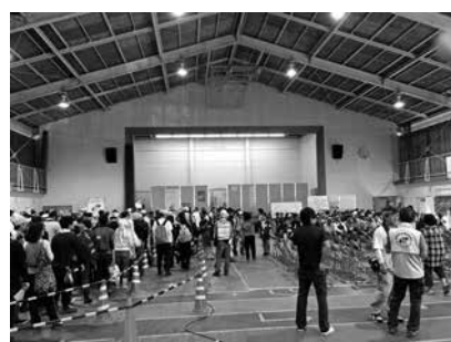
ボランティアセンターでの受付の様子

岡田ミニサテライトという場所は、地域住民が主体となってボランティアセンターを運営されており、活動先へのボランティアの送迎等は地域住民が担っていました。中には被災されている方もいましたが、その状況でも地域のためにと活動されていました。地域住民主体の運営では、①ボランティアと支援が必要な方との調整がスムーズ②地域住民が感じた課題を共有することで新たな支援につながる等いろいろな利点を感じました。岡田地区での取り組みを参考に、いつ起こるかわからない災害に備えて地域のことは地域で支えあうつながりづくりの重要性を改めて感じました。