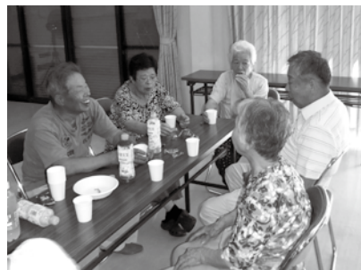
体操のあとの茶話会も 楽しみのひとつです