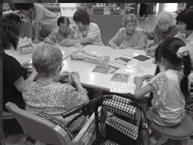
高齢者とのふれあい