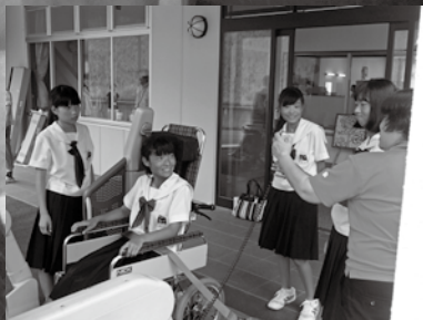
車いす体験と介助