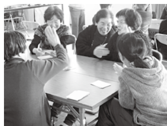
懐かしい絵柄に話も弾みます。