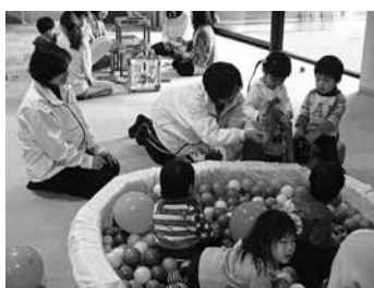
つどいの広場への協力

歳末の時期にあわせて、福祉施設、ひとり暮らし高齢者、生活保護世帯、障害者のいる世帯等を訪問し、激励金品を手渡すとともに生活の様子を確認します。