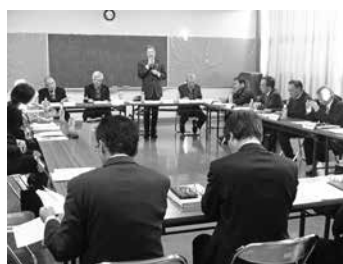
各地区会長による定例会議

子育て中の親子が参加し、仲間作りなどを行っている「つどいの広場」へ主任児童委員が参加・協力し、親子との交流や相談支援を行っています。