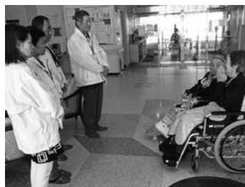
福祉施設への激励訪問

社協が行う月に一度の配食サービスに協力し、ひとり暮らしの高齢者宅等へ見守りを兼ねてお弁当を届けています。