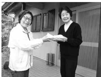
ひとり暮らし高齢者への配食