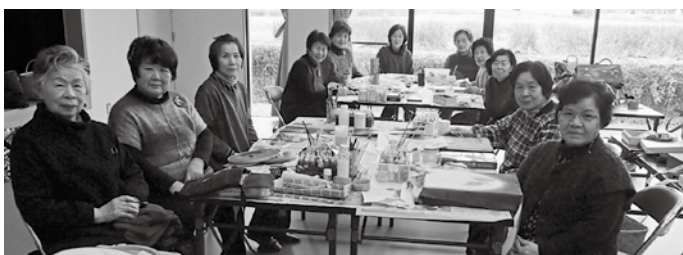
手描き友禅と茶話会で 本日も大盛り上がり