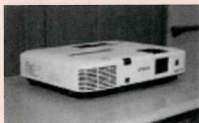
プロジェクター (スクリーン付)