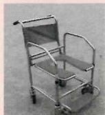
シャワーキャリー