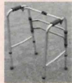
セーフティアーム