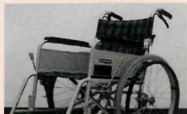
車イス (介助用・自走用)