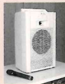
ワイヤレスマイク