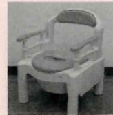
ポータブルトイレ (有料)