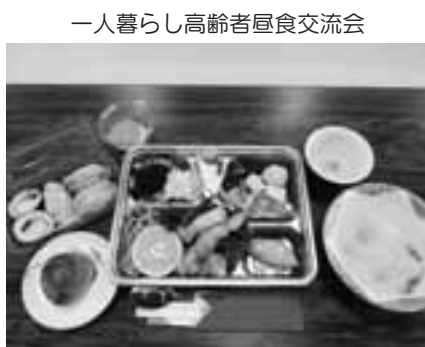
一人暮らし高齢者昼食交流会