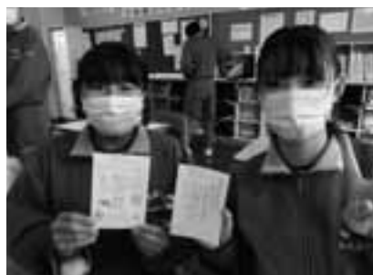
高齢者世帯への年賀状作り