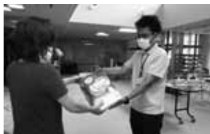
高齢者・障害者紙オムツ配布