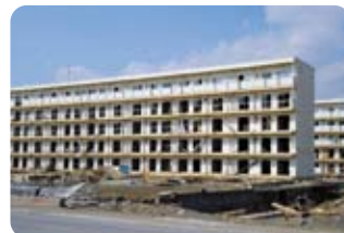
陸前高田市の被害状況