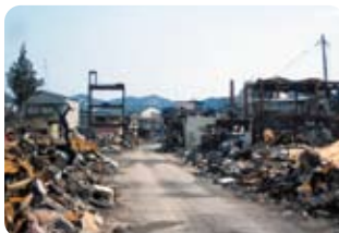
山田町の被害状況

岩手県社会福祉協議会からの要請に基づき、3月23日~29日の間、県内社協職員9名とともに本会から職員1名を派遣し、今後の災害ボランティアセンター運営のための住民ニーズ調査及び生活福祉資金の特例貸付の業務を行って来ました。今後も継続的に静岡県内の社会福祉協議会職員が被災地支援に派遣される予定です。