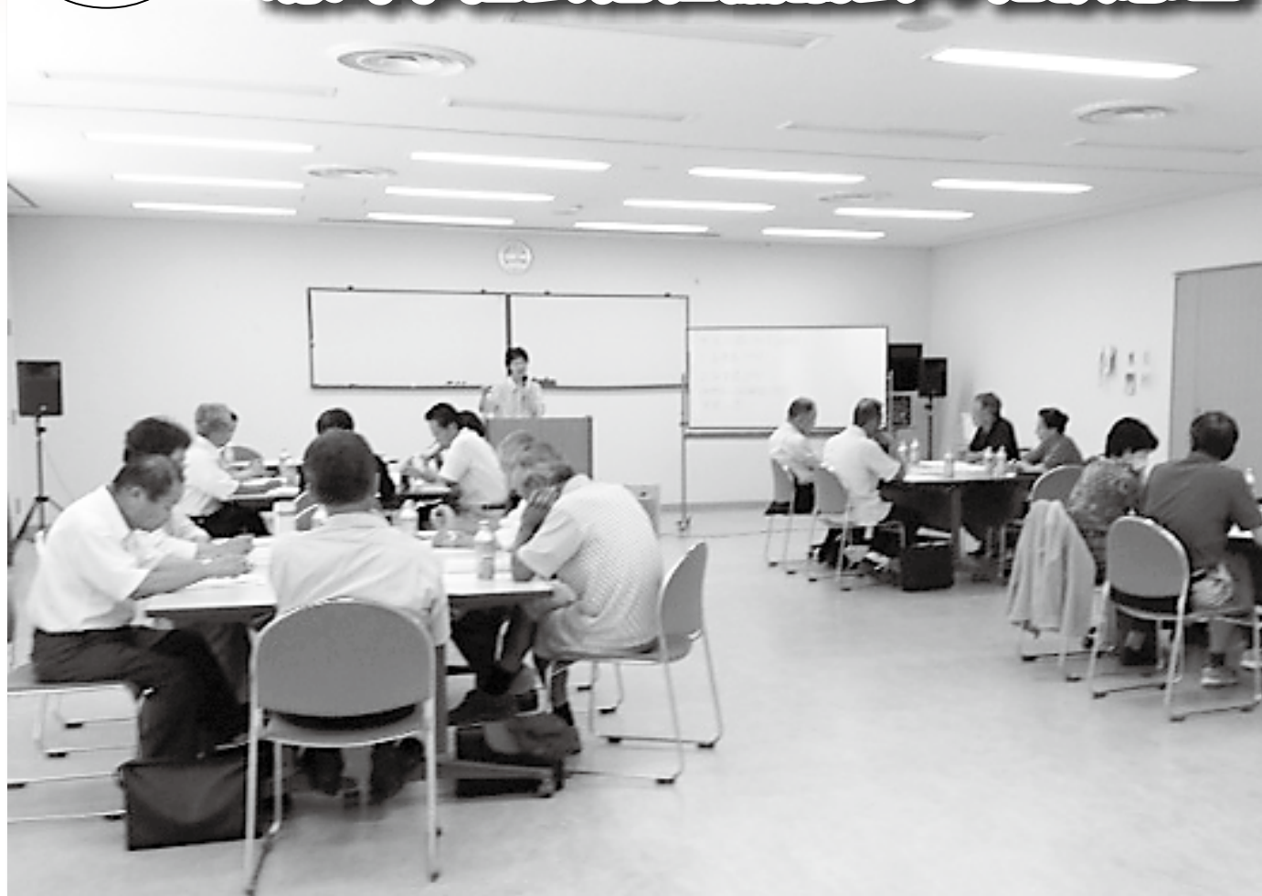
心配ごと相談員研修会