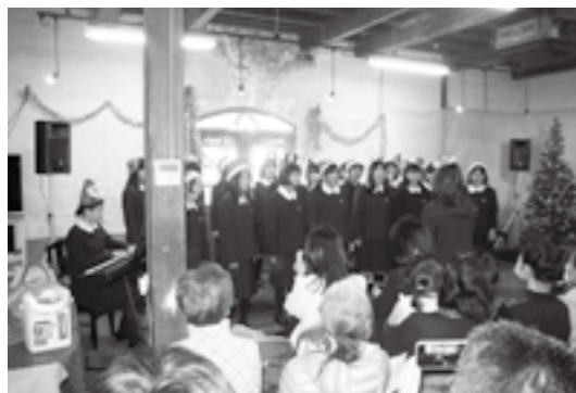
昨年12月に行われたクリスマス会