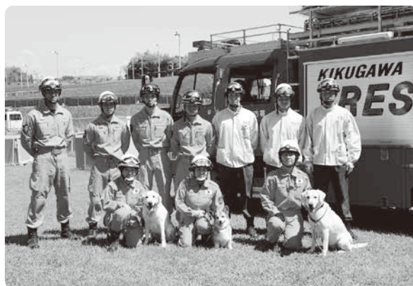
2017年8月 「消防警察災害救助犬総合防災訓練」

今後も救助犬への期待に応えられるよう日々の訓練に精進し、更に多くの方々にご理解いただけるよう各方面で活動する予定です。