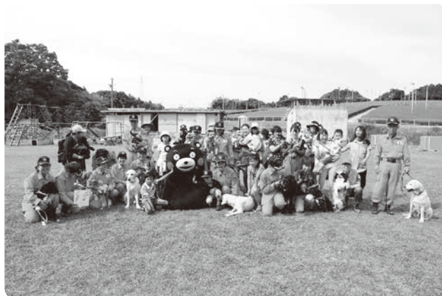
2017年6月 くまもとから感謝をプロジェクト！