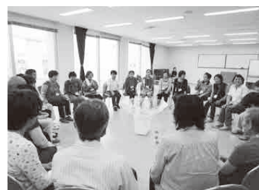
レクリエーション講座で仲間づくりができます