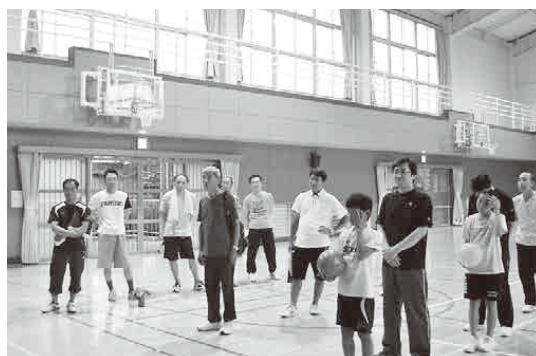
ビーチボール大会