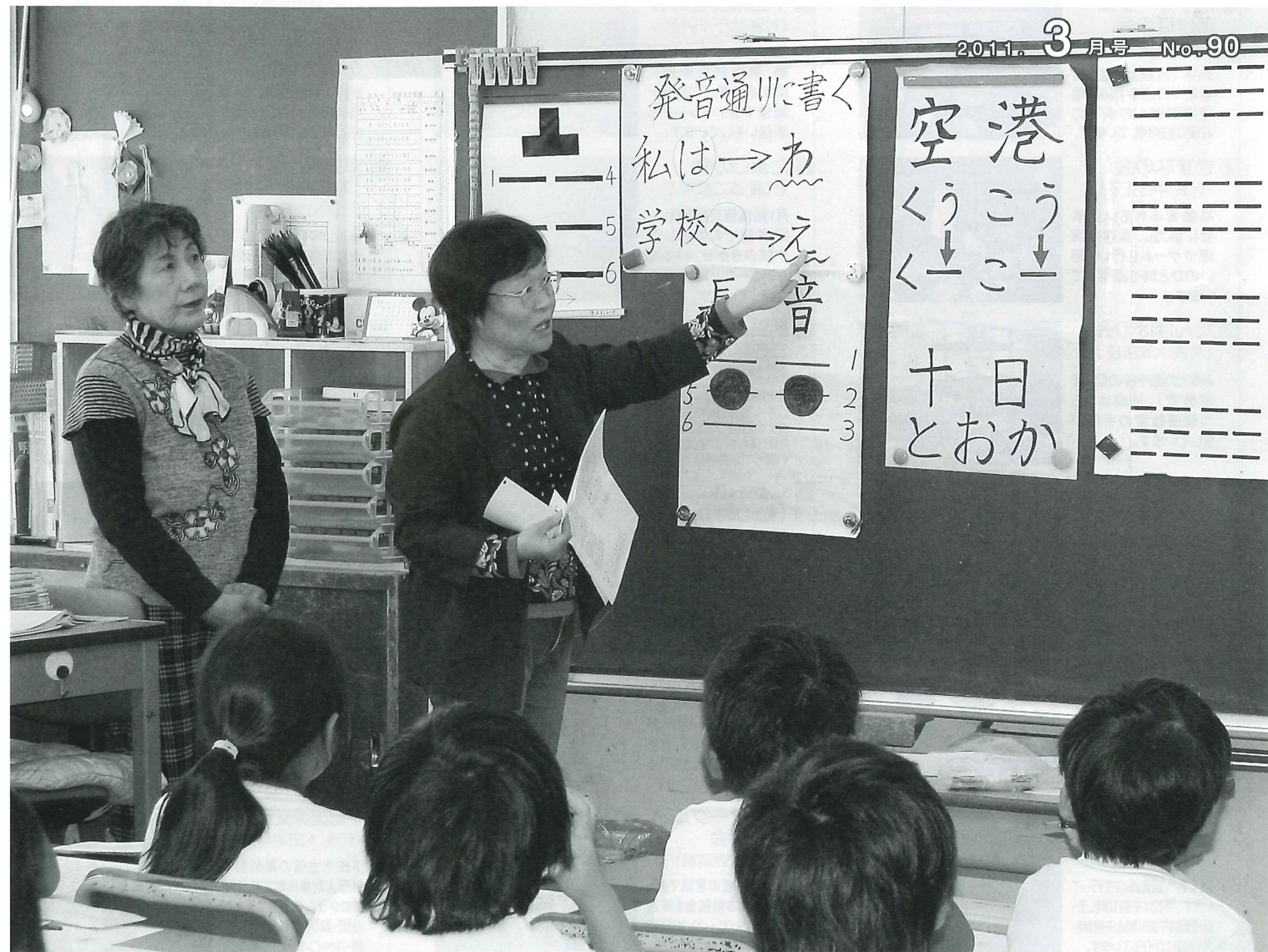
稲生沢小学校での点字授業の様子