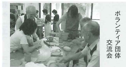
ボランティア団体 交流会