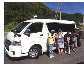
(例)県内全市町村による広域配分金の中から、平成28年度はすぎのこ作業所に送迎用車輦が配備されました。